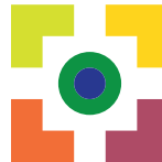
kiezen in verantwoordelijkheid